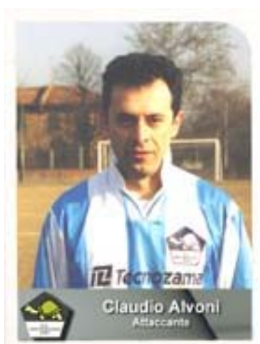
Il Puma guida la classifica marcatori con 5 golassi